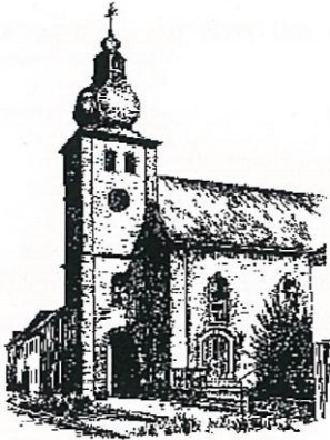
St. Philippus und Jakobus