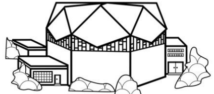
St. Franz Sales