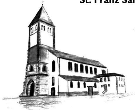
St. Mariä Himmelfahrt