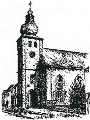
St. Philippus und Jakobus